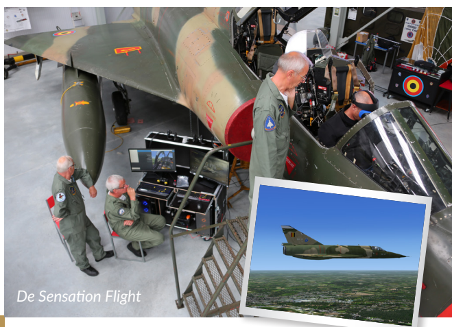
De Sensation Flight

“Nee hoor, je kan voor- of achteraan plaatsnemen in de Mirage, zet een VR-bril op, stijgt in real time op vanaf de basis in Brustem en maakt een vlucht op lage hoogte. Tegen 840 kilometer per uur vlieg je over de streek in gesloten formatie en keer je terug voor een kisslanding. En dat allemaal in volledige 360° beleving. Intussen vliegen de decibels je om de oren en zie je het instrumentenbord werken. Er is nauwelijks verschil met een echte vlucht. Als ex-