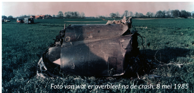
Foto van wat er overbleef na de crash, 8 mei 1985

de kop tikken. Ik koester ze. Het heeft mijn carrière nauwelijks beïnvloed. 's Woensdag ben ik gecrasht, 's maandags ondernam ik alweer een solovlucht, met gebroken rug zo bleek achteraf. Maar het bloed kruipt waar het niet gaan kan. Met één vraag ben ik wel altijd blijven zitten. "Waarom heeft die motor, die ik altijd goed verzorgde, me toen in de steek gelaten?"