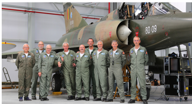
Inschrijven voor een Sensation Flight of meer info over de geschiedenis van de Mirage? Surf naar www.miragebd09.be

"Initieel was het de bedoeling om een fotoboek te maken van 80 bladzijden", vertelt hij. "Maar uiteindelijk werkte elke specialisatie mee, van bewapening tot maintenance, de hele Mirage Pilot Association dus. Het resultaat, in 2017 uitgegeven, is een werk van 448 bladzijden, 2,5 kilogram zwaar. En zoals ik al vertelde schreef koning Filip het voorwoord en tekende hij als ex-leerling en piloot het boek. Nochtans was mijn vraag naar hem toe tegen het protocol in, want aan de koning vraag je niets. Maar ik ging er vanuit dat hij dat niet zou weigeren gezien zijn ervaringen en zijn schitterende prestaties bij ons. De toenmalige prins voerde alle vluchten uit: nachtvluchten, formatievluchten en solovlucht. En neen, hij werd niet ontzien. Nooit. Geen enkele koning voor hem leverde deze prestatie als piloot. Ik herinner me nog steeds de sms die ik kreeg op het Europaplein, met de melding dat hij 'meedeed', het voorwoord wilde schrijven en het boek wou tekenen. Het is nog altijd één van de mooiste momenten uit mijn leven. Een moment om te koesteren."