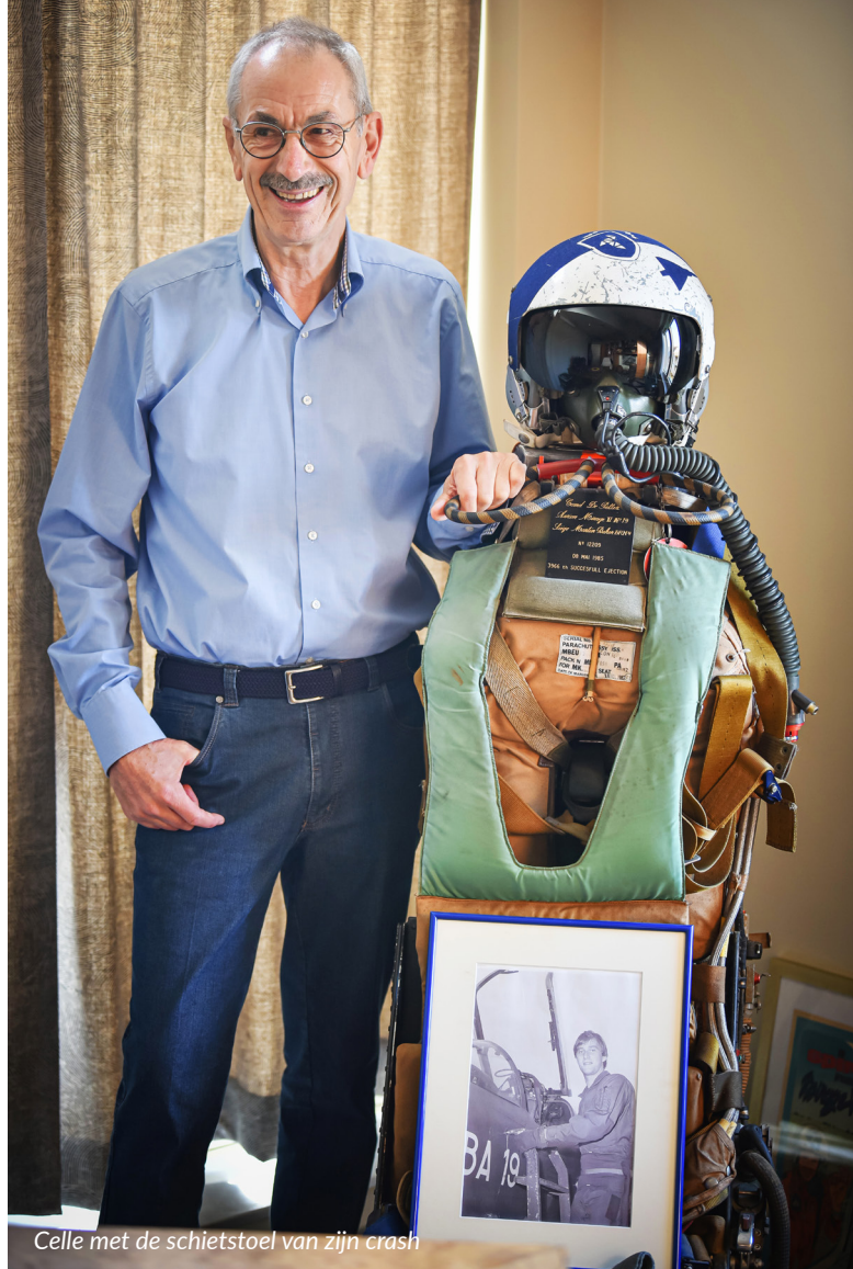
Celle met de schietstoel van zijn crash

piloten na de vlucht zeggen 'dit is net zoals vroeger', dan weet je dat het goed zit. Het is het resultaat van intens teamwerk maar vooral ook van vriendschap, passie en gedrevenheid. Er komt veel volk op af, uit Duitsland, Nederland en Frankrijk. Maar nog te weinig uit onze eigen regio. Bij deze dus. Van harte uitgenodigd.”