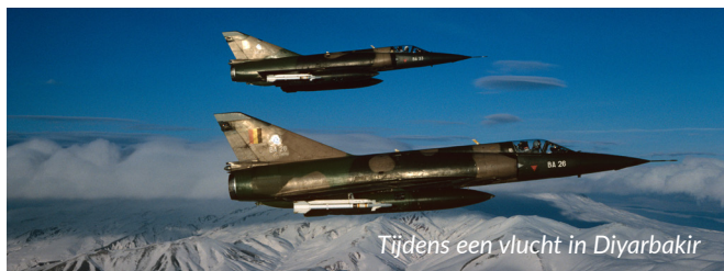
Tijdens een vlucht in Diyarbakir